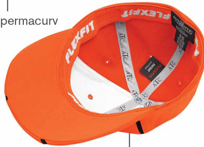
Ruban ATC MC sur les coutures intérieures