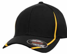
Noir C / 7549C