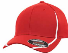
186C / Non PMS