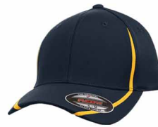
Plus léger que 289C / 7549C