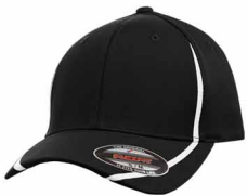
Noir C / Non PMS