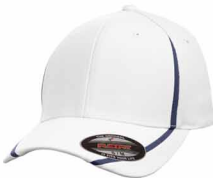
Non PMS / Plus léger que 289C