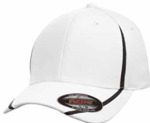
Non PMS / Noir C