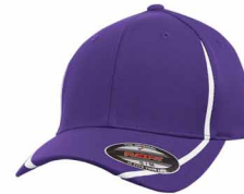
7671C / Non PMS