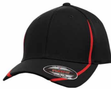
Noir C / 186C