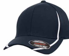
Plus léger que 289C / Non PMS