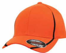
1665C / Noir C