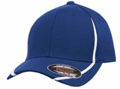
7685C / Non PMS