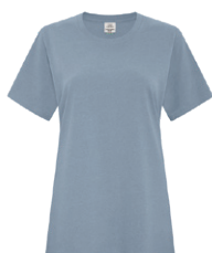
BLEU PIERRE EARTH 2157C