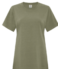
VERT MILITAIRE EARTH 7770C