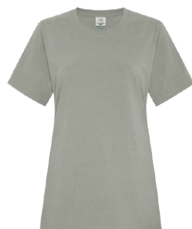
DOVE EARTH 416C