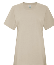
SABLE EARTH 7527C