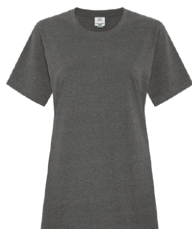
ÉTAIN EARTH Black 7C