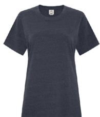
MARINE EARTH 2379C