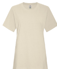
OS EARTH 7534C