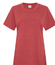
ROUGE EARTH 202C