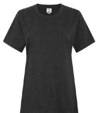
NOIR EARTH Black 3C

Les couleurs des tissus sont sujettes à des variations selon les lots et ne correspondront pas exactement aux couleurs de référence Pantone.