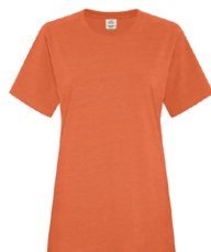
ORANGE EARTH 7579C