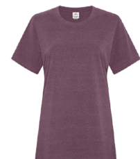
AUBERGINE EARTH 262C