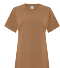
CARAMEL EARTH 7568C