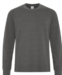
ÉTAIN EARTH Black 7C