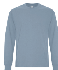
BLEU PIERRE EARTH 2157C