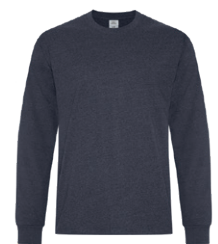
MARINE EARTH 2379C