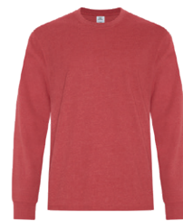
ROUGE EARTH 202C