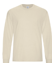
OS EARTH 7534C