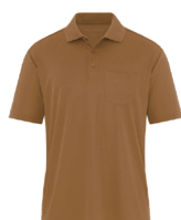
BRUN CANARD 7568C

Vue la nature des polyester, des précautions particulières doivent être prises tout au long du procédé de décoration.