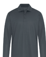
GRIS MÉTAL 7540C