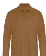
BRUN CANARD 7568C