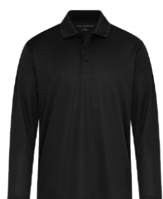
NOIR Black 6C

Les couleurs des tissus sont sujettes à des variations selon les lots et ne correspondront pas exactement aux couleurs de référence Pantone