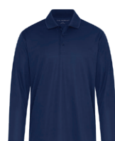
MARINE FRANC 539C