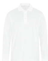
BLANC Aucun PMS