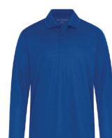
ROYAL FRANC 7686C