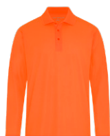
ORANGE SÉCURITÉ Aucun PMS