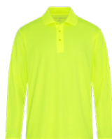
JAUNE SÉCURITÉ Aucun PMS