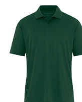
VERT FORÊT 7736C