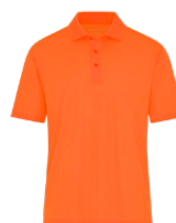
ORANGE SÉCURITÉ Aucun PMS