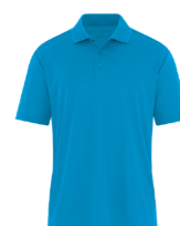
BLEU BRILLANT 7461C