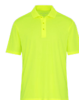
JAUNE SÉCURITÉ Aucun PMS