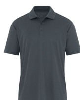
GRIS MÉTAL 7540C