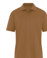
BRUN CANARD 7568C