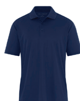
MARINE FRANC 539C