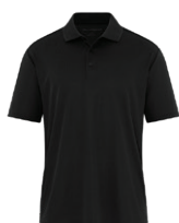
NOIR Black 6C

Les couleurs des tissus sont sujettes à des variations selon les lots et ne correspondront pas exactement aux couleurs de référence Pantone