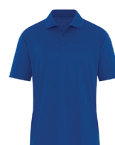
ROYAL FRANC 7686C