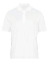
BLANC Aucun PMS