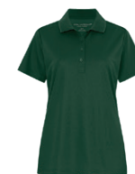
VERT FORÊT 7736C