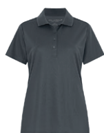
GRIS MÉTAL 7540C