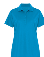
BLEU BRILLANT 7461C