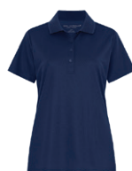
MARINE FRANC 539C