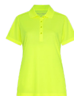
JAUNE SÉCURITÉ Aucun PMS