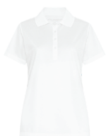
BLANC Aucun PMS