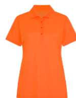
ORANGE SÉCURITÉ Aucun PMS