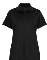
NOIR Black 6C

Les couleurs des tissus sont sujettes à des variations selon les lots et ne correspondront pas exactement aux couleurs de référence Pantone