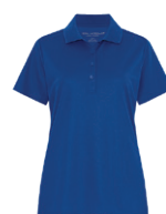
ROYAL FRANC 7686C