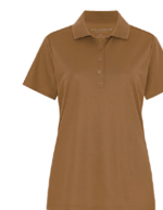
BRUN CANARD 7568C