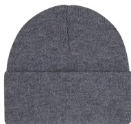
OXFORD ATHLÉTIQUE* Cool Grey 10C