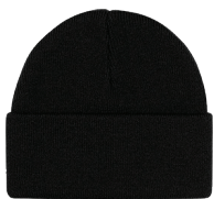
NOIR Black 6C

Les couleurs des tissus sont sujettes à des variations selon les lots et ne correspondront pas exactement aux couleurs de référence Pantone.