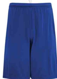
Entre 7686C et 7687C