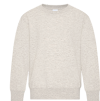
AVOINE CHINÉ Warm Grey 2C