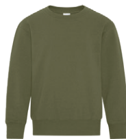
VERT MILITAIRE 7771C