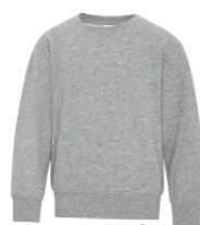
CHINÉ ATHLÉTIQUE Cool Grey 5C