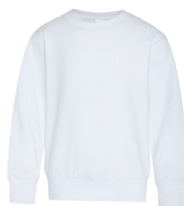
BLANC Aucun PMS