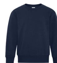
ÉQUIPE MARINE 533C