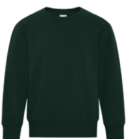
VERT FONCÉ 5467C