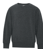
GRIS FONCÉ CHINÉ 7540C