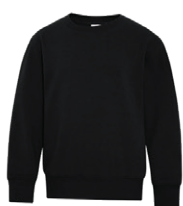
NOIR Black 6C

Les couleurs des tissus textiles sont sujettes aux variations du lot de teinture et ne correspondront pas exactement à la référence Pantone imprimée.