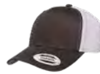
CHARBON/BLANC Cool Grey 11C/ Aucun PMS