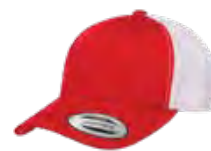
ROUGE/BLANC 200C/Aucun PMS