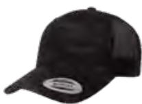
MULTICAM® NOIR*/ NOIR Aucun PMS/Black 6C