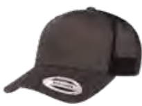
CHARBON/NOIR Cool Grey 11C/ Black 6C