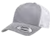
CHINÉ/BLANC Cool Grey 9C/ Aucun PMS