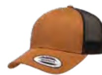
CAMEL/NOIR 730C/Black 6C