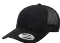
NOIR/NOIR Black 6C/Black 6C

Les couleurs des tissus sont sujets à des variation selon les lots et ne correspondront pas exactement aux couleurs de référence pantone