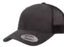
CHARBON/CHARBON Cool Grey 11C/ Cool Grey 11C