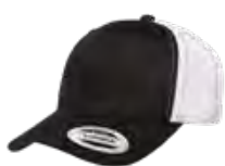
NOIR/BLANC Black 6C/Aucun PMS