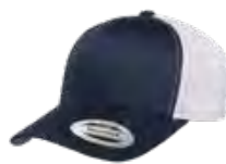
MARINE/BLANC 533C/Aucun PMS