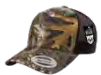
REALTREE EDGE®**/ BRUN Aucun PMS/2479C