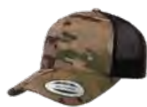
MULTICAM®*/NOIR Aucun PMS/Black 6C