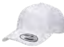
BLANC/BLANC Aucun PMS/ Aucun PMS