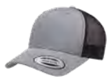
CHINÉ/NOIR Cool Grey 9C/ Black 6C