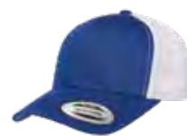
ROYAL/BLANC 7687C/Aucun PMS